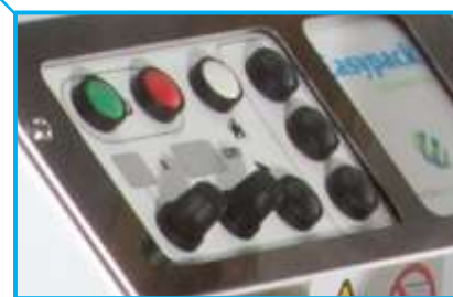
Programmierbare Kombinationen aus Polsterlänge und –menge