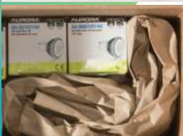
Papierrollen sparen wertvolle Lagerfläche - Polster haben bis zu 60-faches Volumen des Ausgangsmaterials