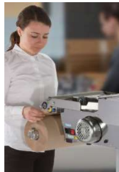
Die packmate™pro verbraucht 25 % weniger Papier!

Die neue Technologie von Easypack bietet fortschrittliche Leistung und einen höheren Ertrag bei gleichbleibender Qualität und Stärke der Papierpolster. Versandartikel können nun effizienter durch weniger Materialeinsatz optimal während des Transports geschützt werden.