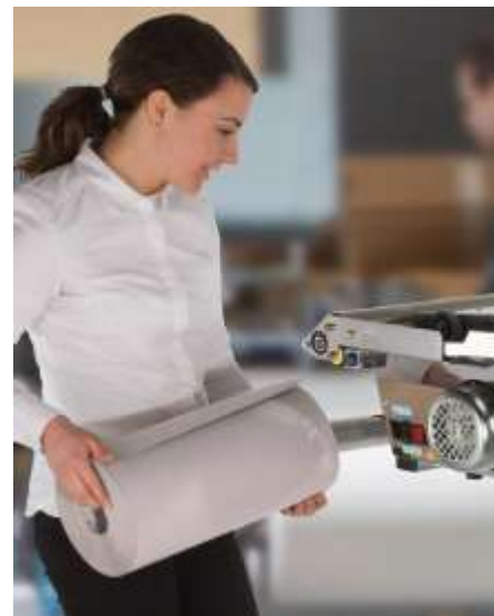
Verarbeitet ein- oder zweilagiges 100 % Recyclingpapier verschiedener Stärken