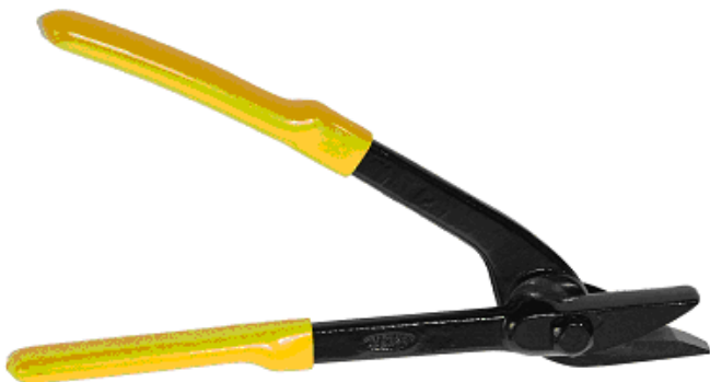
Stahlband-Schere H 201 Für Normal- und Hochleistungs-Stahlband mit Breite 10 – 32 mm Art.-Nr. 16.1081