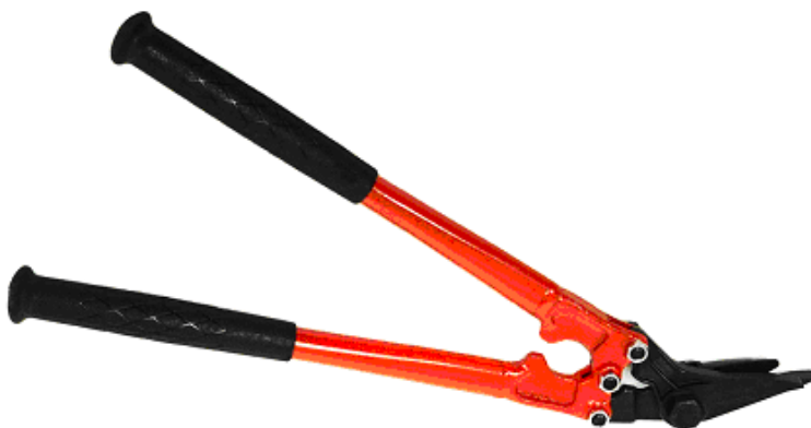
Stahlband-Schere H 300 Für Normal- und Hochleistungs-Stahlband mit Breite 32 – 50 mm Art.-Nr. 16.1030