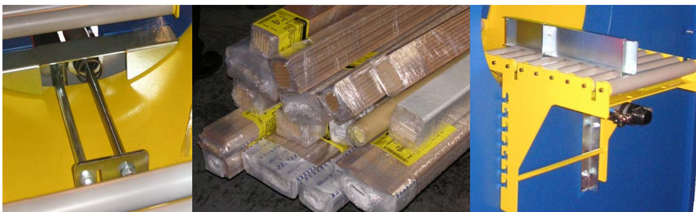
EasyWrap™ FV205 Halbautomatische, vertikale Kleinbündelwickelmaschine